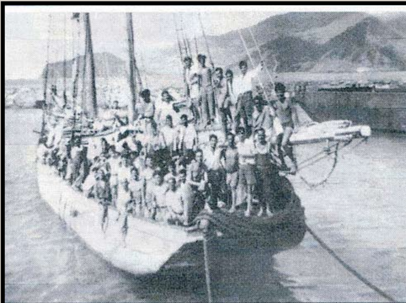
Imagen de los tripulantes de "La Elvira" a su llegada a Puerto de Garupano, Venezuela, en Mayo 1949