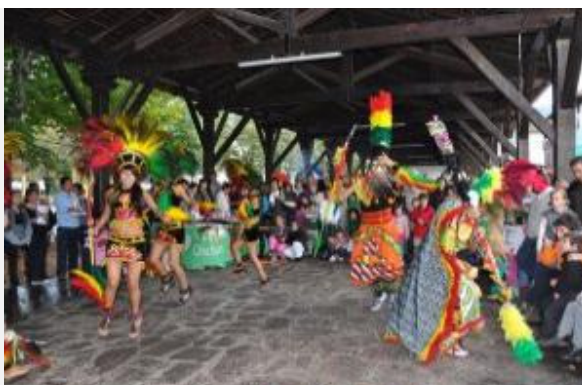
Variado y multicolor espectáculo de bailes como muestra de cultura