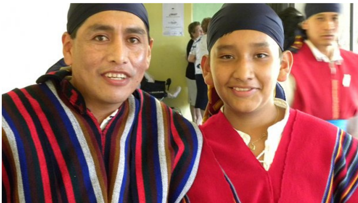
Miembros del grupo de danzas ecuatoriano Alma Latina.

aitor arotzena - Jueves, 3 de Diciembre de 2009 - Actualizado a las 07:33h.