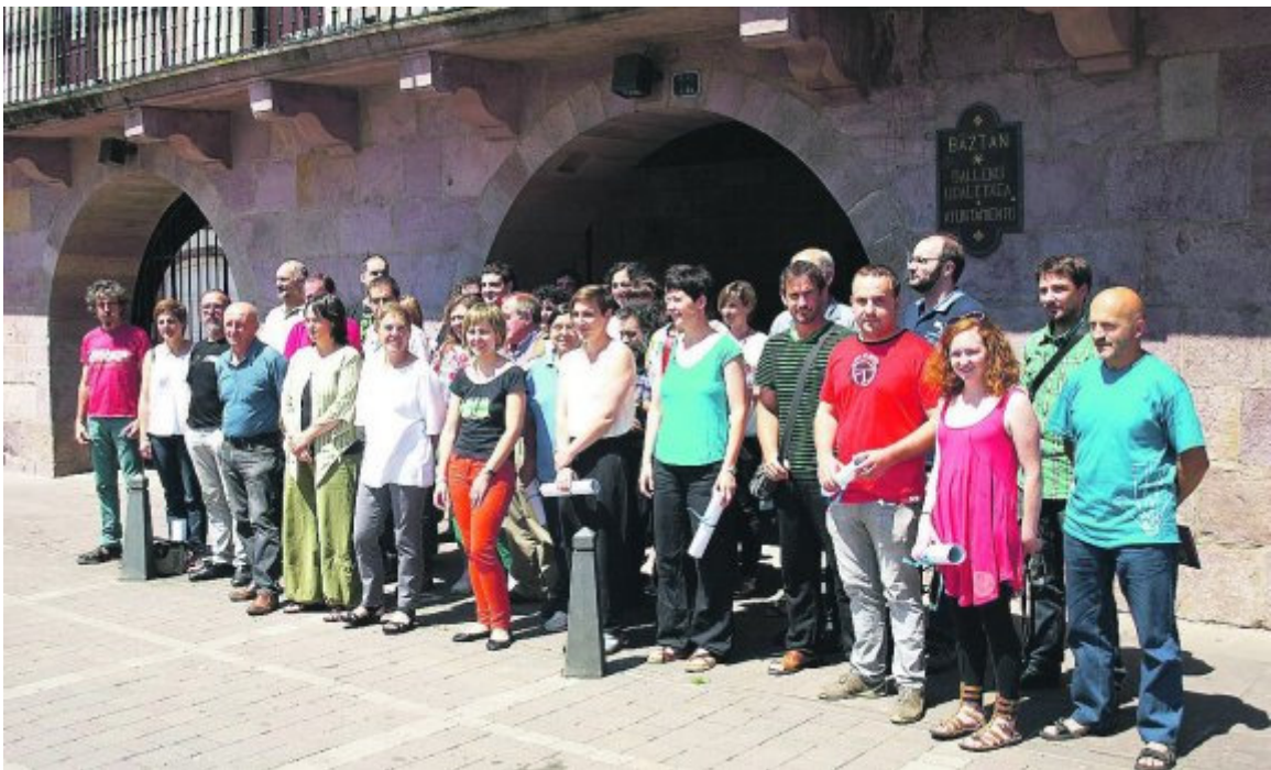
Proyectos. Representantes de los proyectos seleccionados.