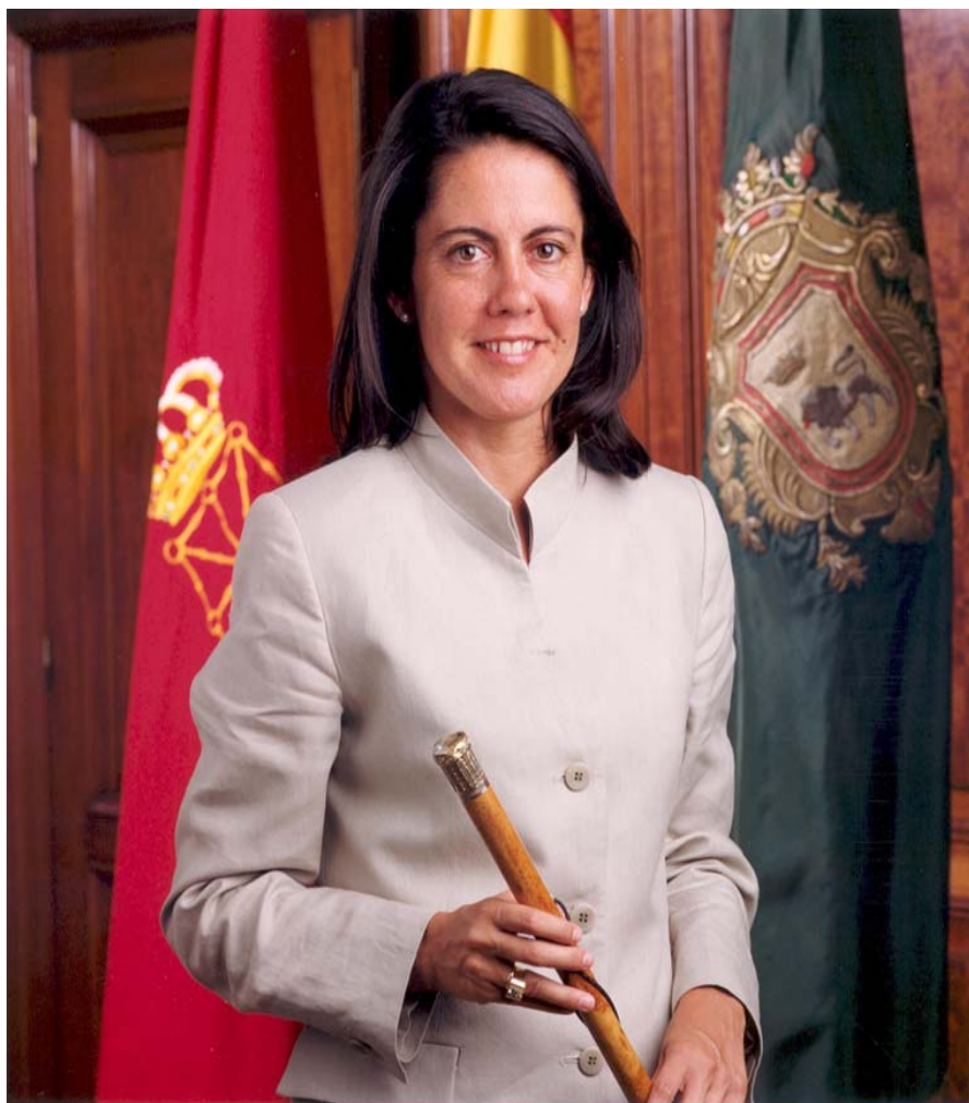
Yolanda Barcina Angulo Alcaldesa de Pamplona

Bienvenido a Pamplona. En esta guía encontrará información actualizada sobre los principales servicios y recursos que ofrece tanto el Ayuntamiento de Pamplona como otras instituciones y que pueden ser de especial utilidad para las personas que procedentes de otras latitudes eligen nuestra ciudad para desarrollar en ella sus proyectos vitales y profesionales. Quiere ser, por lo tanto, un instrumento eficaz dirigido a todas las personas que deseen conocer mejor Pamplona y las posibilidades que ésta les ofrece.